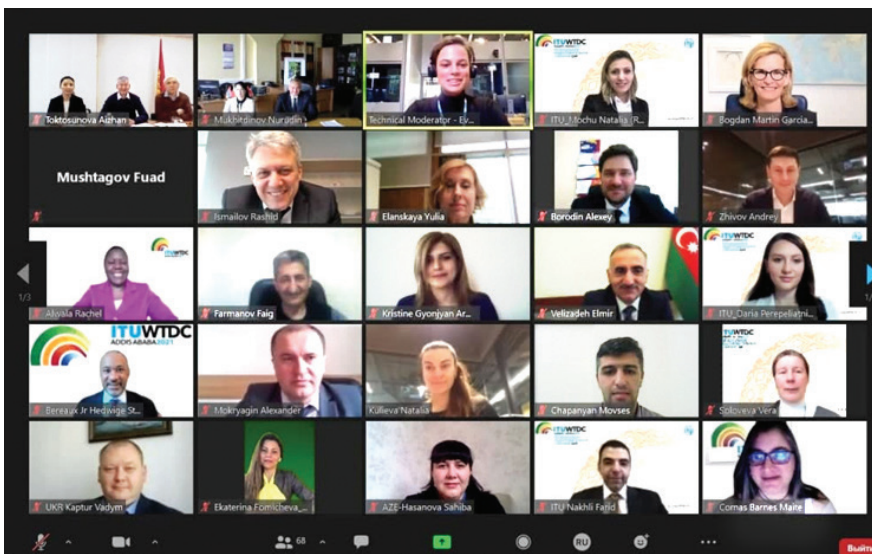
РПС СНГ в формате видеоконференцсвязи

Региональная инициатива 1 — развитие инфраструктуры в интересах содействия инновациям и партнерству в сфере внедрения таких новых технологий, как интернет вещей и промышленный интернет вещей, умные города и сообщества, сети связи 5G/IMT-2020 и последующих поколений NET-2030, квантовые технологии, искусственный интеллект, цифровое здравоохранение, цифровые навыки, защита окружающей среды.