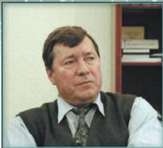
Геннадий Георгиевич Кудрявцев (в 1991 г. — министр связи СССР):

“После известных событий (август 1991 г.) все министры союзных ведомств были отстранены от работы. Но продолжали выполнять свои функции где-то до середины ноября.