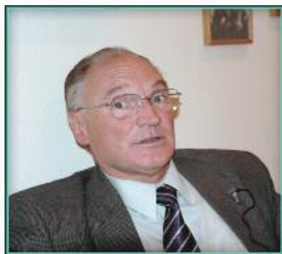
Владимир Борисович Булгак (в 1991 г. — министр связи Российской Федерации):

междугородной и международной связи, взаиморасчетов, почтового обмена, связанные с учебой в институтах и техникумах связи, со строительством и военно-восстановительным управлением. Одним словом, был целый ряд глобальных вопросов, которые просто нельзя было пустить на самотек. Я считаю, что была выполнена довольно серьезная работа, которая позволила организовать Интертелеком и РСС, которые работают успешно до сегодняшнего дня”.