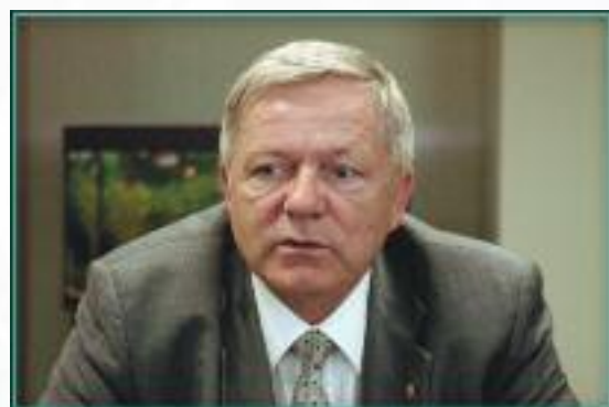
Вячеслав Федорович Гуркин (в 1991 г. — член коллегии Министерства связи СССР):

“В Москве в конце 1991 г. в Минсвязи РФ после распада СССР по инициативе министров связи России, Украины, Белоруссии и ряда других стран СНГ было учреждено Региональное содружество в области связи, которое играет координирующую роль как в регионе, так и при решении вопросов в международных организациях электросвязи и почты”.