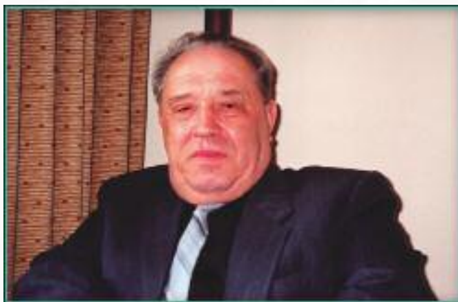
Иван Михайлович Грицук (в 1991 г. — министр связи Республики Беларусь):

это и произошло во многих отраслях промышленности. Но в связи все сохранилось, все состоялось цивилизованно. И административное разделение не повлияло на целостность сети — благодаря и нашему пониманию, и со стороны России, в частности тогдашнего министра связи РСФСР В.Б. Булгака и министра связи СССР Г.Г. Кудрявцева. У меня остались хорошие воспоминания от работы с москвичами — они всегда с пониманием и уважением относились к республикам”.